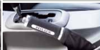
SKÓRZANA DŹWIGNIA HAMULCA RĘCZNEGO