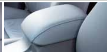
SZARY PODŁOKIETNIK PCV STYLIZOWANY NA SKÓRĘ