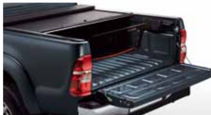
SYSTEM PODZIAŁU PRZESTRZENI BAGAŻOWEJ CARGO MANAGER