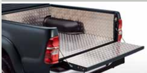
WYKŁADZINA ALUMINIOWA PRZESTRZENI BAGAŻOWEJ