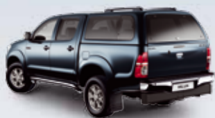
ZABUDOWA Z BOCZNYMI SZYBAMI