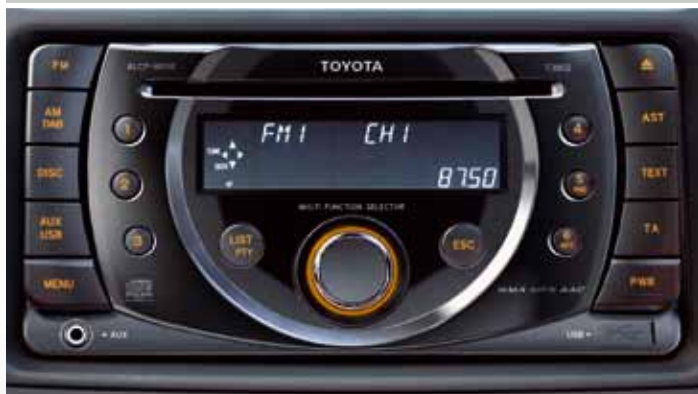
RADIO + CD: WYŚWIETLACZ OLED, INTELIGENTNY PRZYCIŚK OBSŁUGI RADIA, WYJŚCIA AUX, USB/iPod KOMPATYBILNE Z DAB, MP3/WMA/AAC, AUTOMATYCZNA REGULACJA GŁOŚNOŚCI, OBUDOWA ZIELONA LUB BURSZTYNOWA, 4 MODUŁY DŹWIĘKU (FLAT, COMPACT, SUV, SEDAN)