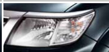
CHROMOWANE OBUDOWY PRZEDNICH REFLEKTORÓW