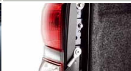
USZCZELNIENIE PRZESTRZENI BAGAŻOWEJ

Prezentowane elementy nie należą do standardowego wyposażenia samochodu. Sprawdź pełną ofertę akcesoriów na www.toyota-akcesoria.pl