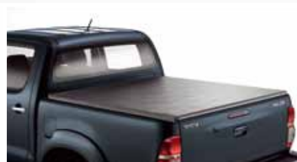
ELASTYCZNA OSŁONA PRZESTRZENI BAGAŻOWEJ