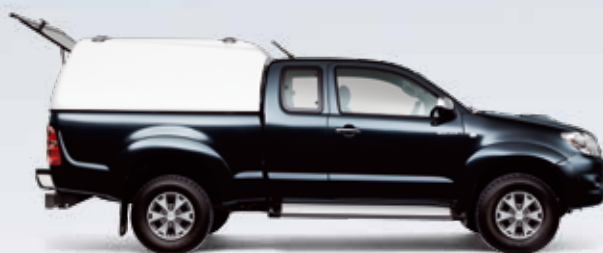
ZABUDOWA W WERSJI DOSTAWCZEJ