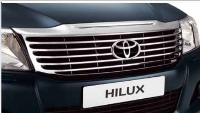
CHROMOWANY GRILL PRZEDNI