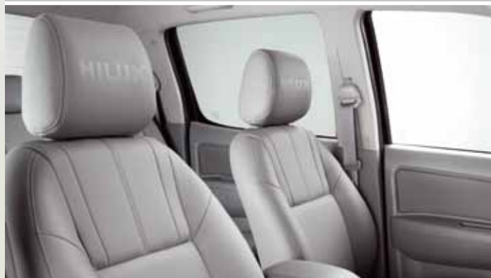
WYSOKIEJ JAKOŚCI TAPICERKA SKÓRZANA Z LOGO HILUX INVINCIBLE