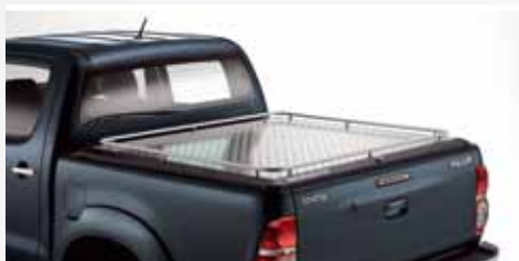
ALUMINIOWA OSŁONA PRZESTRZENI BAGAŻOWEJ