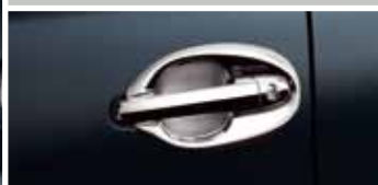
CHROMOWANE OBUDOWY KLAMEK