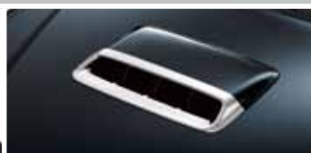
CHROMOWANA OBUDOWA WŁOTU POWIETRZA