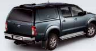
ZABUDOWA Z BOCZNYMI DRZWIČKAMI