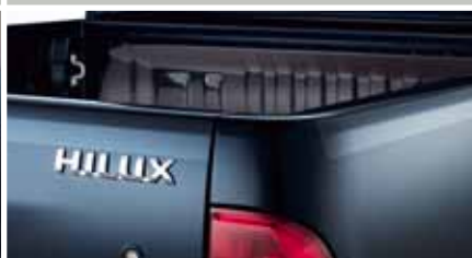
FOLIA OCHRONNA NA TYLNĄ KŁAPĘ