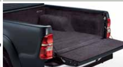
WYKŁADZINA WELUROWA PRZESTRZENI BAGAŻOWEJ