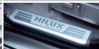
ALUMINIOWE NAKŁADKI PROGOWE PRZEDNIE I TYLNE Z LOGO HILUX INVINCIBLE