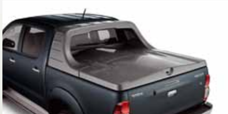
TWARDA OSŁONA PRZESTRZENI BAGAŻOWEJ