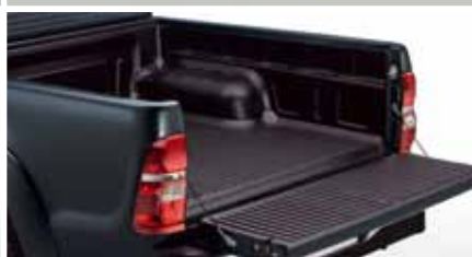
WYKŁADZINA PCV PRZESTRZENI BAGAŻOWEJ