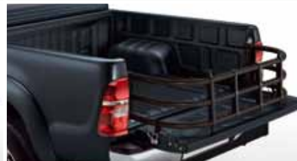
PRZEDŁUŻENIE PRZESTRZENI BAGAŻOWEJ