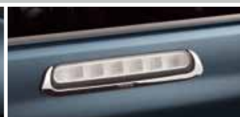
CHROMOWANA OBUDOWA ŚWIATŁA STOP