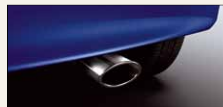
Końcówka rury wydechowej