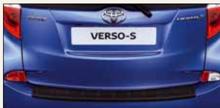
Listwa ochronna na tylny zderzak