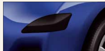
Nakładki ochronne na narożniki zderzaków