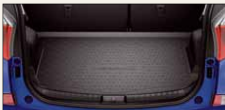
Gumowa wykładzina bagażnika